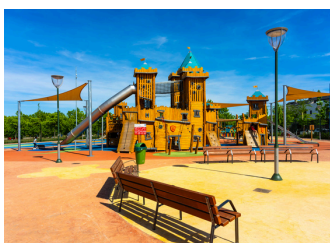
Parque de la Osa Menor en Leganés