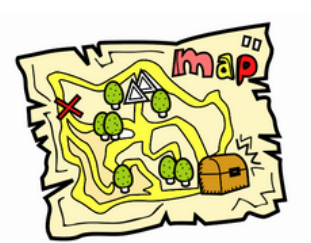
Crea tu propio mapa del tesoro. Déjales pistas para que encuentren su premio.