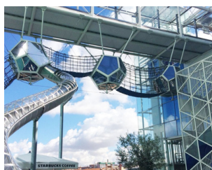
Espacio Wow para niños de 7 a 12 años