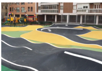
Pista Pump Track

Después de un mes lleno de gastos como ha sido diciembre, os proponemos algunas actividades de carácter lúdico que resulten económicas o incluso gratuitas.