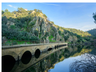
Vía Verde del Río Alberche en bicicleta o andando