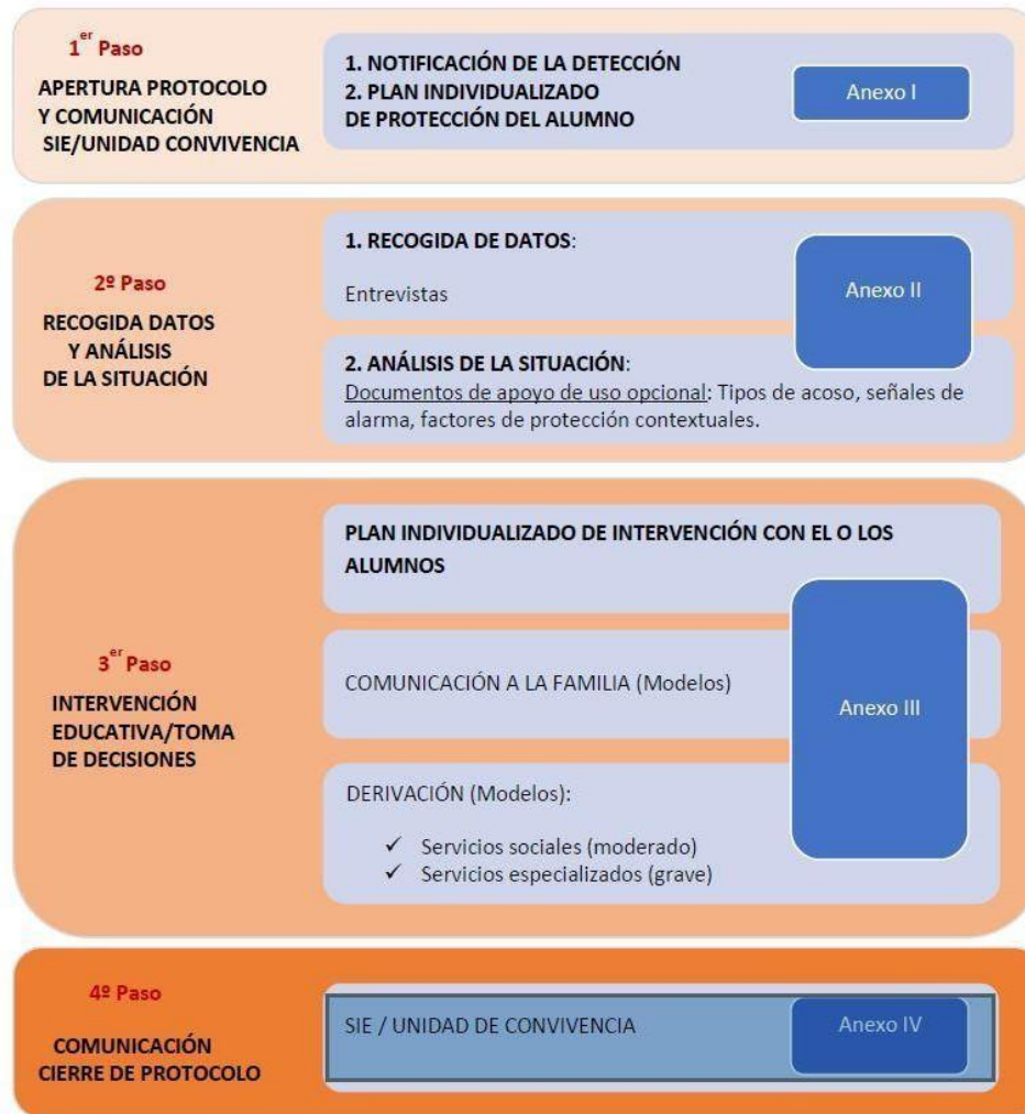
Diagrama de actuaciones